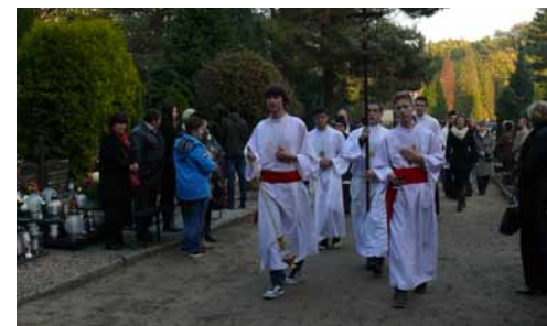
Wszystkich Świętych na obornickim cmentarzu.