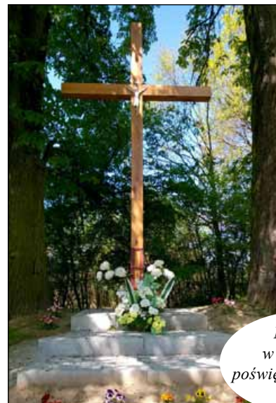
Nowy krzyż w Piekarach, poświęcony 16 IV 2016 r.